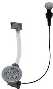
Vidange automatique Gun metal 8407 110